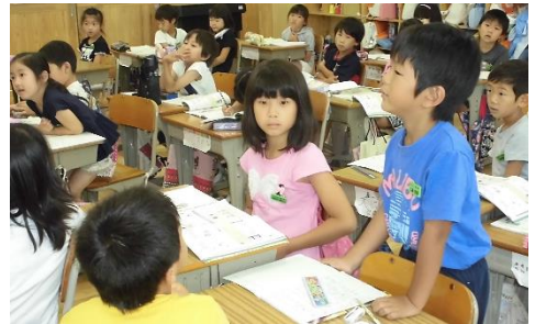
《1学期の授業風景から》